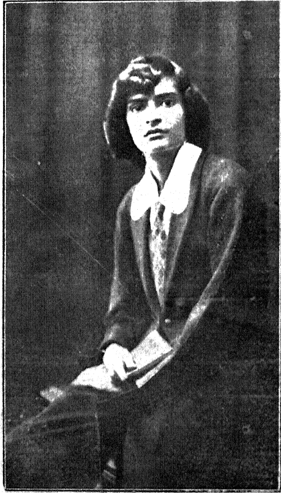
श्री सुमित्रानन्दन पन्त (१९२७)